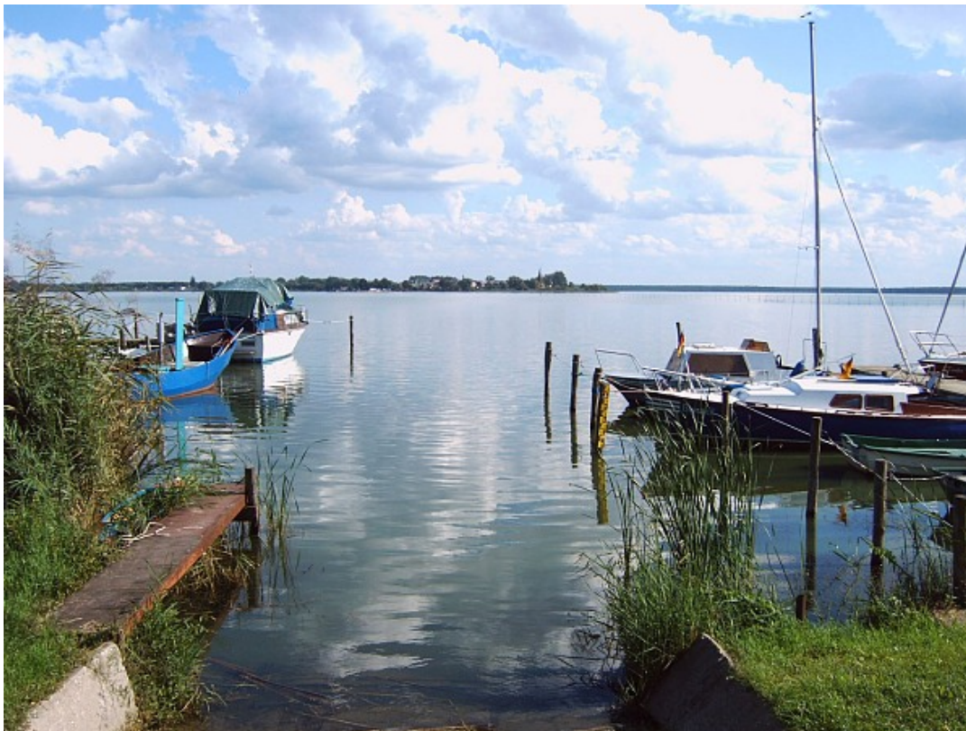
Foto 1 : Stettiner Haff: Blick von Altwarp (Deutschland) nach Nowe Warpno (Polen)