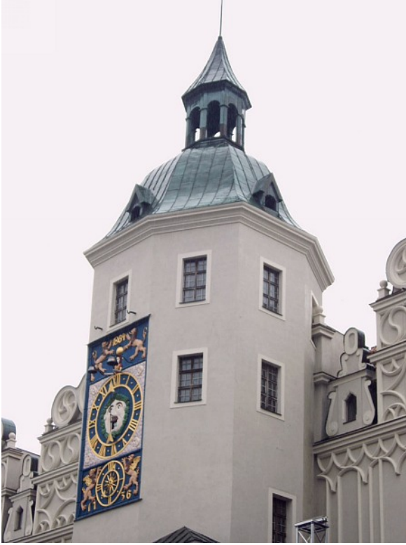
Foto2 : Kulturelle Besonderheiten : Das Stettiner Schloss