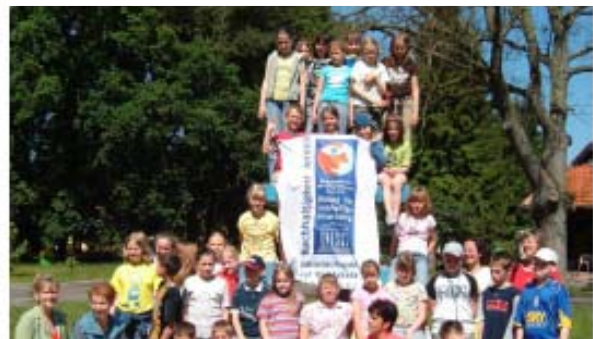
Foto 3 : Regionaler deutsch-polnischer Jugendworkshop in Podgradzie (Polen), 2006