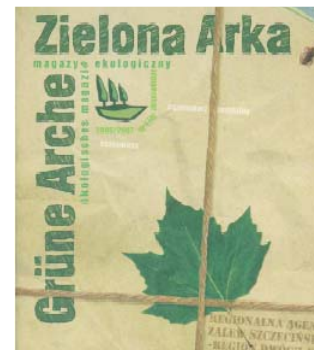
Fig 2 : Die deutsch-polnische Zeitschrift Zielona Arka- Grüne Arche

Haff waren die jährlich die deutsch-polnischen